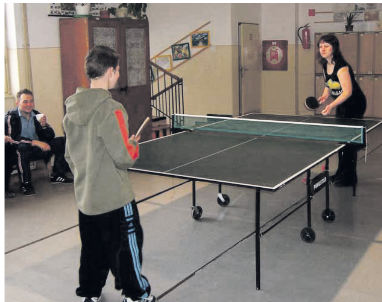
Juraj Švento foto archív klubu

„V nedávno skončenej VI. lige 2019/2020 skončilo A-mužstvo štvrté s 9-bodovým odstupom za postupujúcou Východnou B. Druhá trieda, v ktorej máme „béčko“ a „céčko,“ sa ešte neskončila. Úspešnejšie z nich je v tabuľke druhé B-družstvo. Vďaka úspechom našich tímov i jednotlivcov sa nám darí udržať klub v činnosti. Pravidelne organizujeme Vianočný turnaj pre registrovaných i neregistrovaných hráčov a záujemcov z obce či okolia. Súťažné zápasy hrajeme v jedálni Lesného komposesorátu v Partizánskej Ľupči. Plány má každý z nás veľké. Z tých spoločných je to napríklad postúpiť do piatej ligy, vychovať z našich mladých školákov nových členov a založiť žiacke družstvo, ktoré by reprezentovalo obec a školu. Sny sú na to, aby sa snívajú a pomaly pretavovali do skutočných ideí a konaní. Veríme, že sa raz naplnia a náš klub bude žiť „večne.“