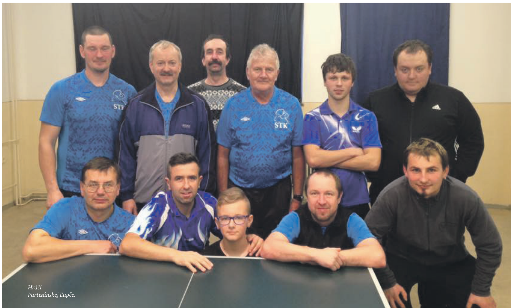
Hráči Partizánskej Lupče.